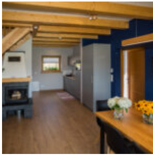
Wnętrze domku - open space.

(Spójrzcie na te wygodne sypialnie - to wg mnie najlepszy wybór na wypoczynek dla całej Rodziny! Na pewno będziemy je testować wraz z dziećmi! Sypialnie z jednym łóżkiem nazwałam "baby", bo zachęcają do wypraw w Pieniny w towarzystwie dzieci. Dla najmłodszych, dostępne jest dziecięce łóżeczko).