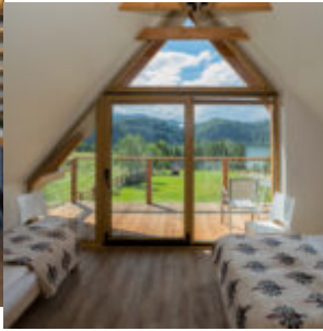
Sypialnia na piętrze z widokiem na jezioro.