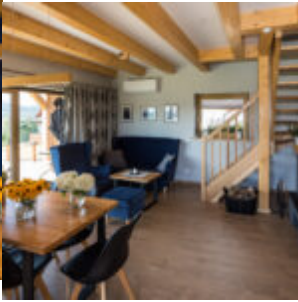
Wnętrze domku - salon.