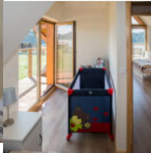
Pokój z łóżkiem dziecięcym oraz sypialnia w tle.